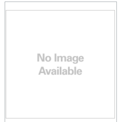
丸型防水コネクタ (M12 スマートクリック)