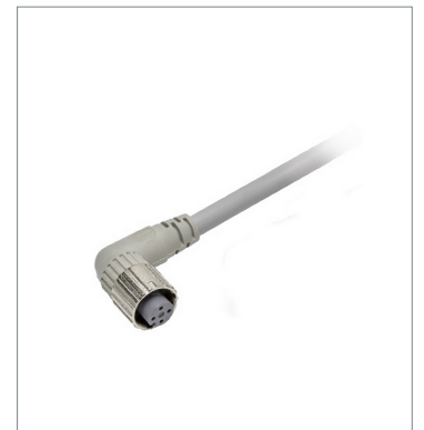
丸型防水コネクタ (M12 スマートクリック)