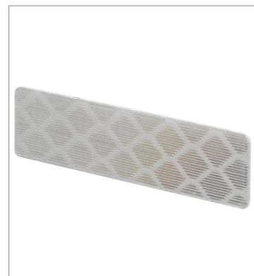
Tape Reflector E39-RS1