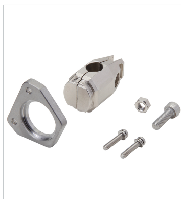
Photoelectric sensor accessories E39-L261