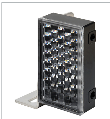
Small Reflector E39-R3