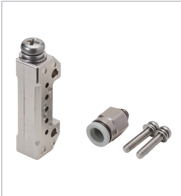
Air Blow Unit E39-E16