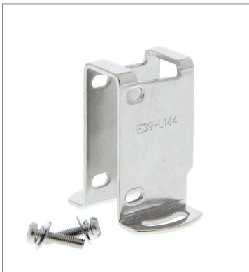
Compact Protective Cover Bracket E39-L144