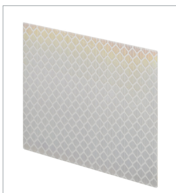
Tape Reflector E39-RS3