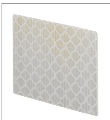
Tape Reflector E39-RS2