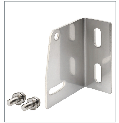
背面取り付け用金具