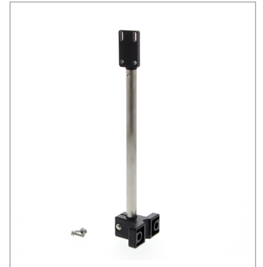
センサアジャスタ E39-L151