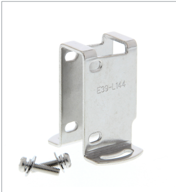
小形保護カバー金具 E39-L144