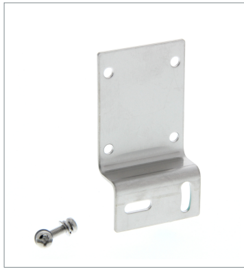
ヨコ形取り付け金具