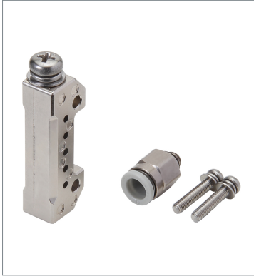
エアローユニット E39-E16