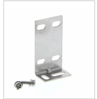
センサ取り付け金具 E39-L153