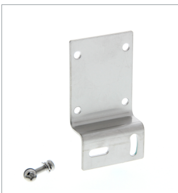
Horizontal Mounting Bracket E39-L43