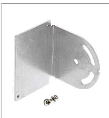
Mounting Bracket E39-L96