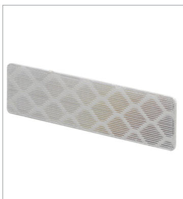
Tape Reflector E39-RS1