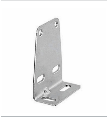
Mounting Bracket for Sensor E39-L104