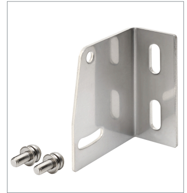
Back-mounting Bracket E39-L44