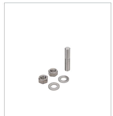
Photoelectric sensor accessories E39-L262