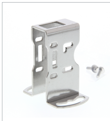
Metal Protective Cover Bracket