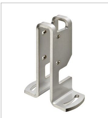
Photoelectric sensor accessories E39-L214