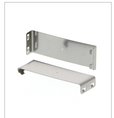
Plug-in type Slit