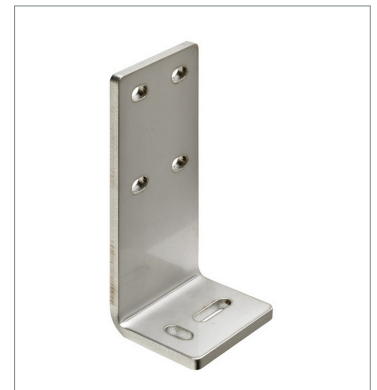
Photoelectric sensor accessories E39-L211