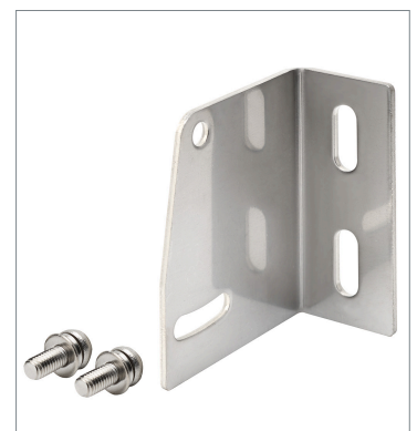
Back-mounting Bracket E39-L44