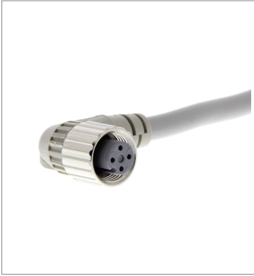
Round Water-resistant Connector (M12 Threads)