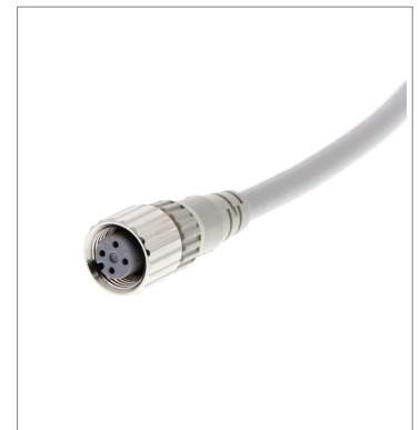
Round Water-resistant Connector (M12 Threads)