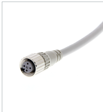
Round Water-resistant Connector (M12 Threads)