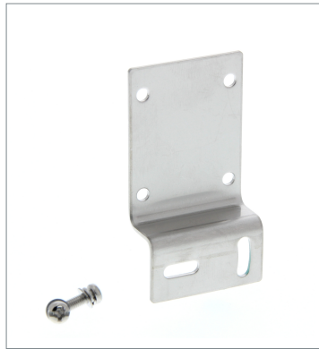
Horizontal Mounting Bracket