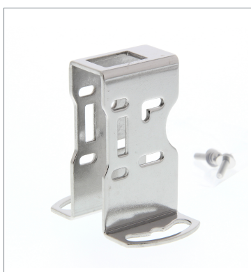
Metal Protective Cover Bracket E39-L98