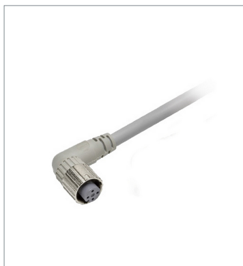
Round Water-resistant Connector (M12 Smartclick) XS5F-D422-G80-F