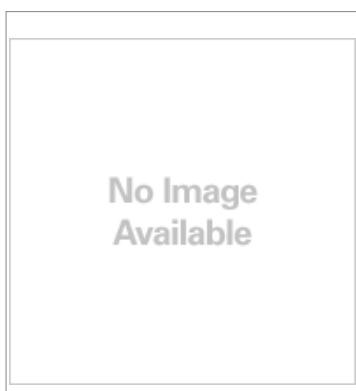
Round Water-resistant Connector (M12 Smartclick) XS5F-D421-D80-F