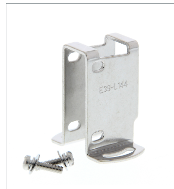
Compact Protective Cover Bracket E39-L144