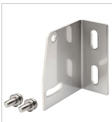
Back-mounting Bracket E39-L44