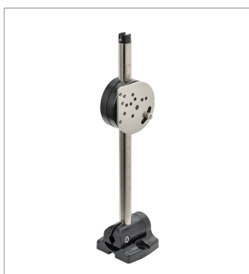
Sensor Adjuster E39-L93FH