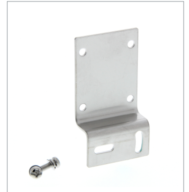
ヨコ形取り付け金具 E39-L43