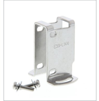
小形保護カバー金具 E39-L144