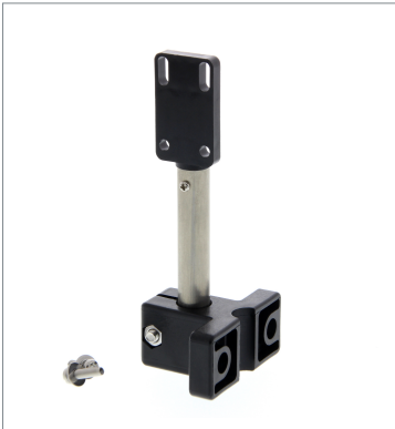
センサアジャスタ E39-L150