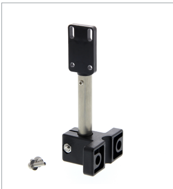
Sensor Adjuster E39-L150