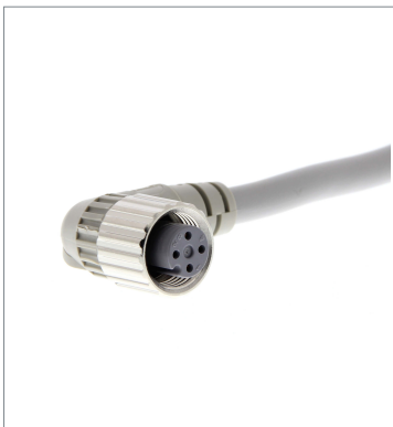
丸型防水コネクタ (M12ねじ式) XS2F-D422-D80-F