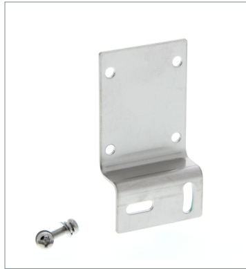
Horizontal Mounting Bracket E39-L43