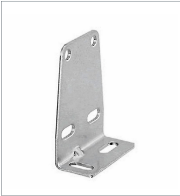
Mounting Bracket for Sensor E39-L104