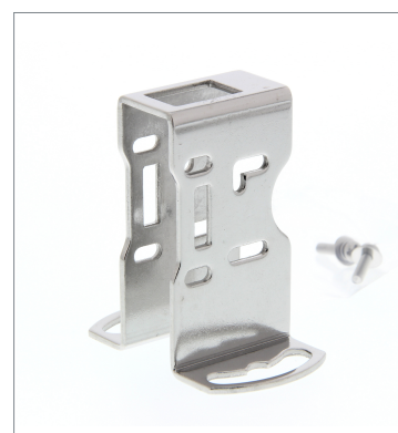
Metal Protective Cover Bracket E39-L98