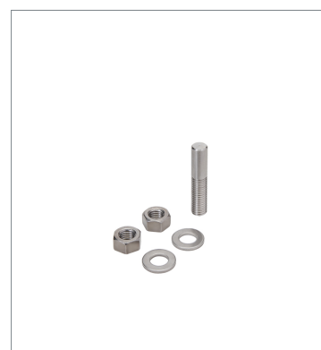
光電センサアクセサリ E39-L262