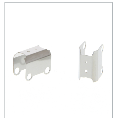
はめ込みタイプスリット E39-S63