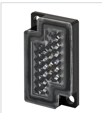
Small Reflector E39-R4