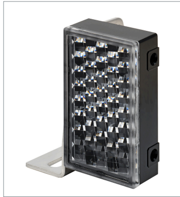
Small Reflector E39-R3