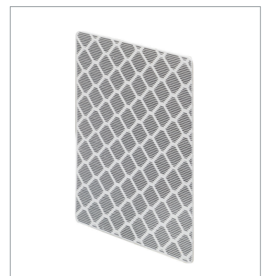
Tape Reflector E39-RS2-CA