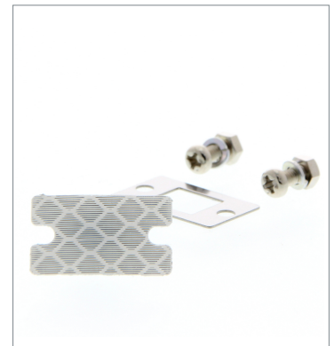
Small Reflector E39-R37-CA