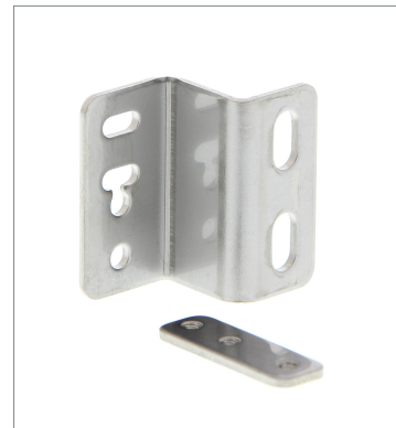
Mounting Bracket E39-L118