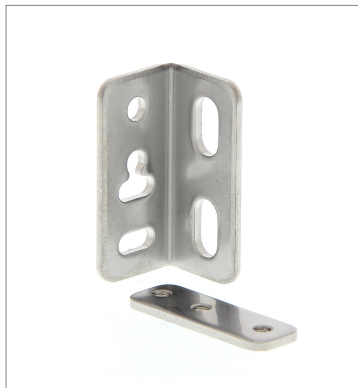
Mounting Bracket E39-L117