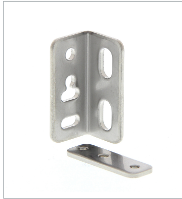
Mounting Bracket E39-L117