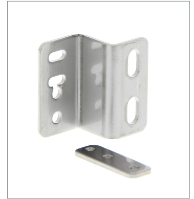
Mounting Bracket E39-L118