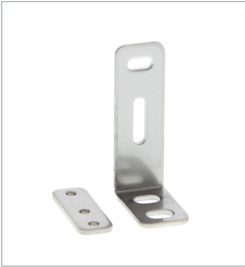
Mounting Bracket E39-L116