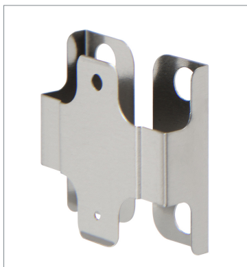
はめ込みタイプスリット E39-S64