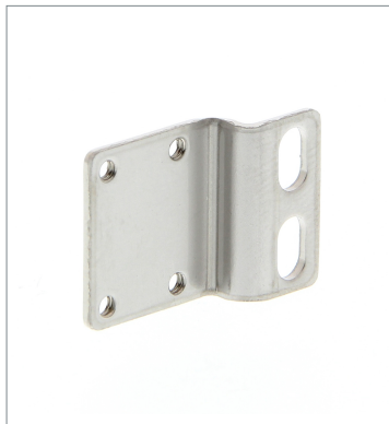
Mounting Bracket E39-L120