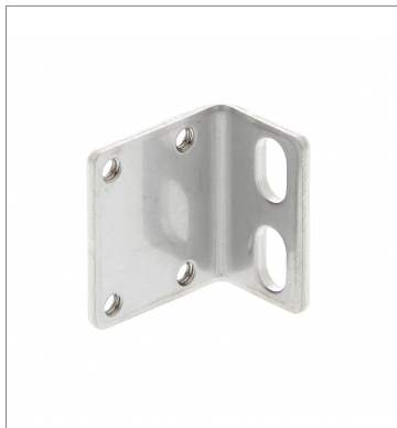
Mounting Bracket E39-L119