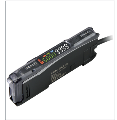
デジタルアンプ分離光電センサ（レーザタイプ） E3C-LDA21N 2M