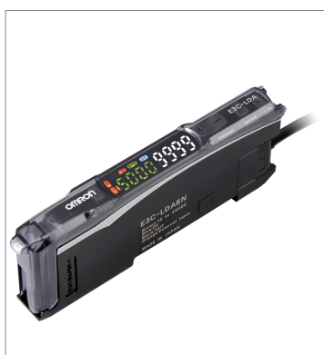
Photoelectric Sensor with Separate Digital Amplifier (Laser-type) E3C-LDA6N