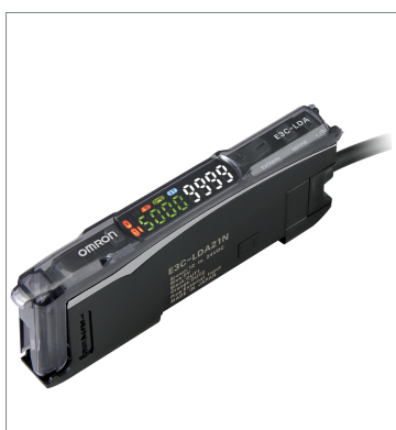
Photoelectric Sensor with Separate Digital Amplifier (Laser-type) E3C-LDA51N 2M