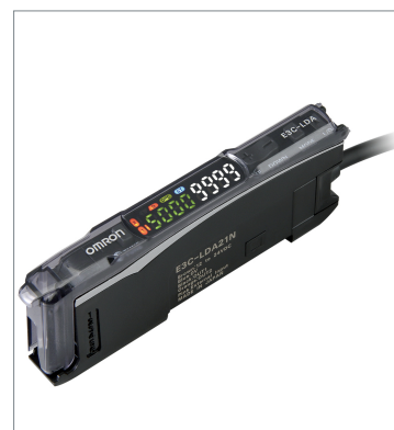
Photoelectric Sensor with Separate Digital Amplifier (Laser-type) E3C-LDA21N 2M