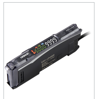
デジタルアンプ分離光電センサ（レーザタイプ） E3C-LDA6N