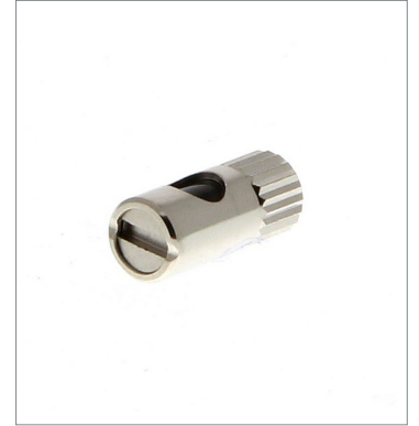
Lens Unit E39-F2