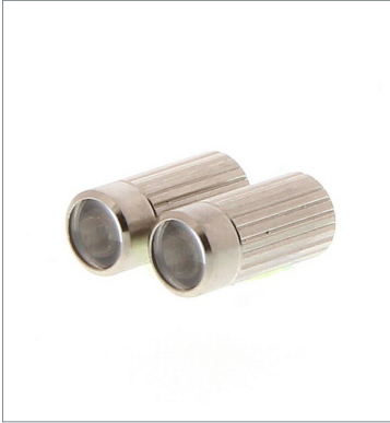
Lens Unit E39-F1