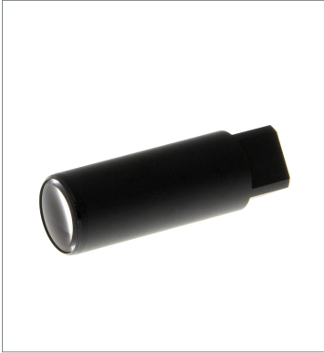
Lens Unit E39-F18