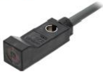
取り付け金具装着時