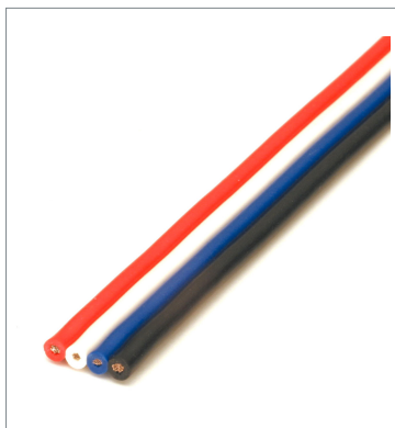
Flat cable DCA4-4F10