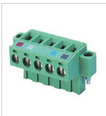
Parallel connector with screws XW4B-05C1-H1-D