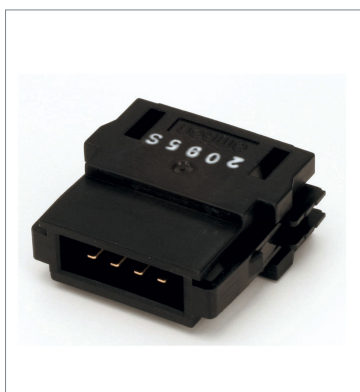
Termination resistor DCN4-TM4