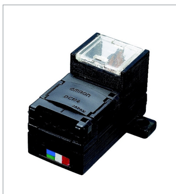
Power Supply Terminal Block with Terminating Resistance for Flat Cable DCN4-TP4D