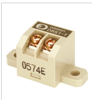
Terminal-block Terminator DRS1-T