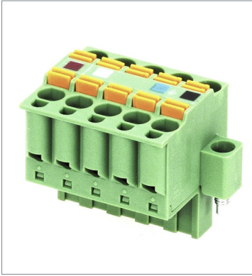
Parallel multi-branching clamp connector with screws