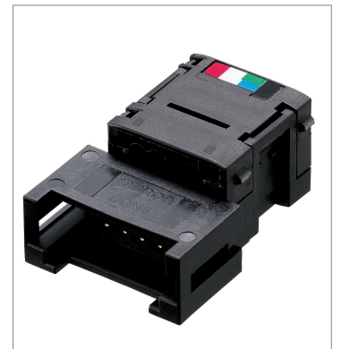
Flat Connector (Socket) DCN4-TR4