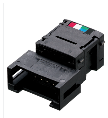
フラットコネクタ (ソケット) DCN4-TR4