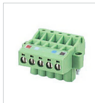
ねじ付き平行型マルチ分岐用コネク タ XW4B-05C4-TF-D