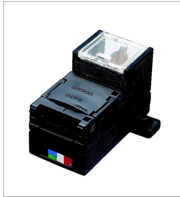
Power Supply Terminal Block with Terminating Resistance for Flat Cable DCN4-TP4D