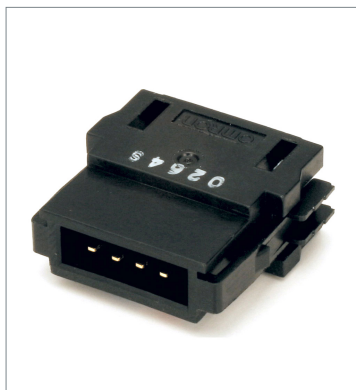
フラットコネクタ (プラグ) DCN4-BR4