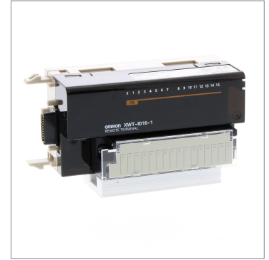
Remote I/O Terminal XWT-ID16