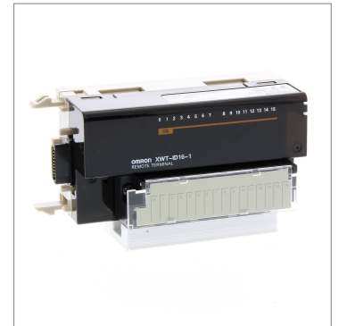
Remote I/O Terminal XWT-ID16