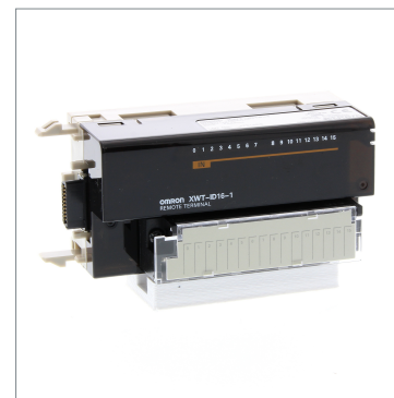
リモートI/Oターミナル