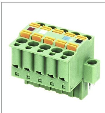
ねじ付きクランプ式平行型マルチ分岐用コネクタ