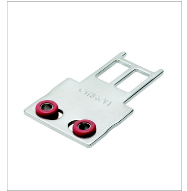
Operation key D4SL-NK1G