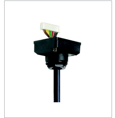
Connector cable D4SL-CN3