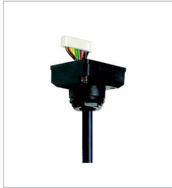
Connector cable D4SL-CN10