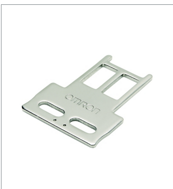
Operation key D4SL-NK1S