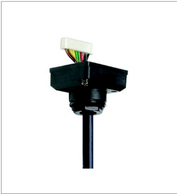
Connector cable D4SL-CN5