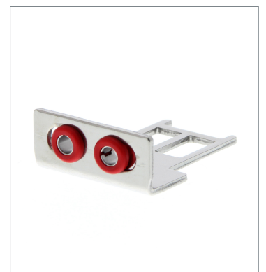
Operation key D4SL-NK2G