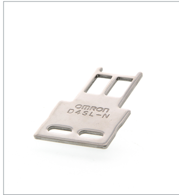
Operation key D4SL-NK1