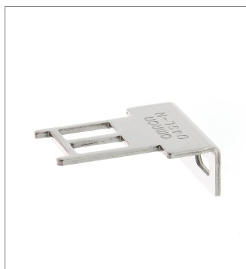
Operation key D4SL-NK2