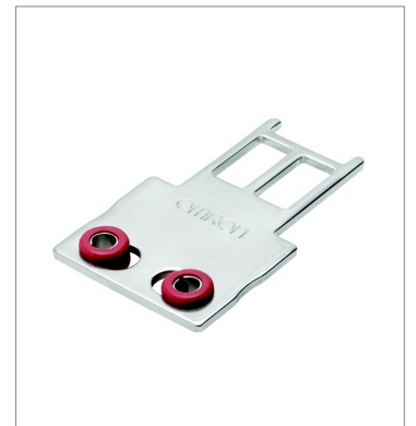
Operation key D4SL-NK1G