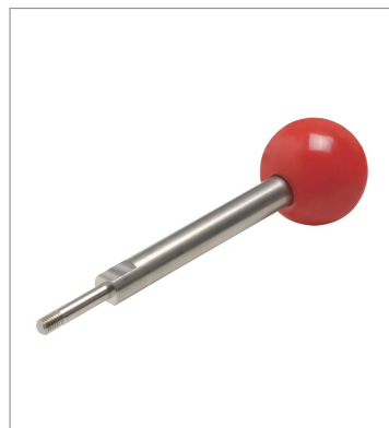
Inner lever for Slide Key Unit