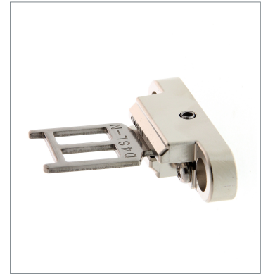
Operation key D4SL-NK3