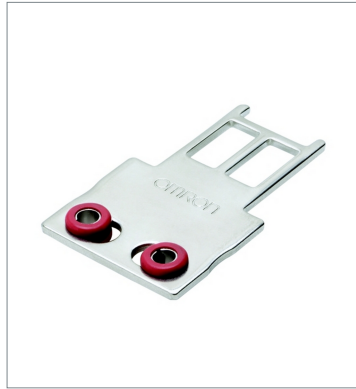
Operation key D4SL-NK1G