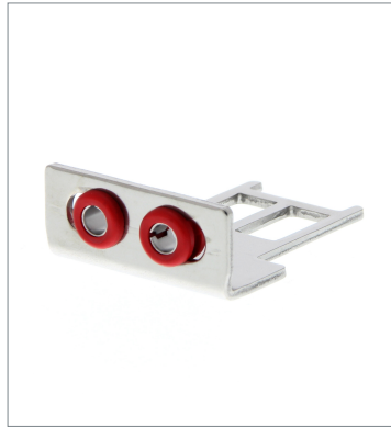
Operation key D4SL-NK2G