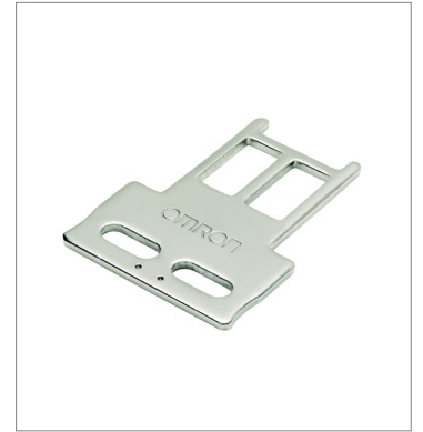
Operation key D4SL-NK1S