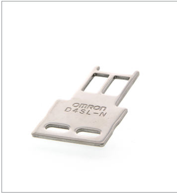
Operation key D4SL-NK1