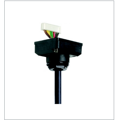
Connector cable D4SL-CN3