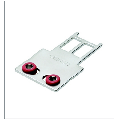
Operation key D4SL-NK1G