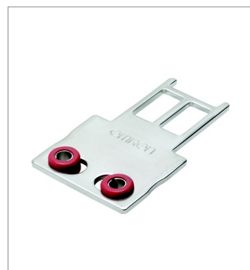
Operation key D4SL-NK1G