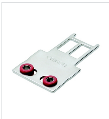
Operation key D4SL-NK1G