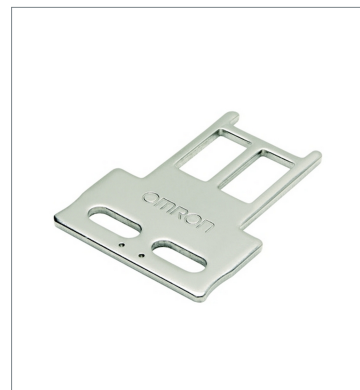
Operation key D4SL-NK1S