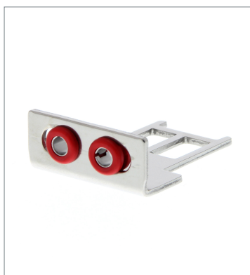
Operation key D4SL-NK2G