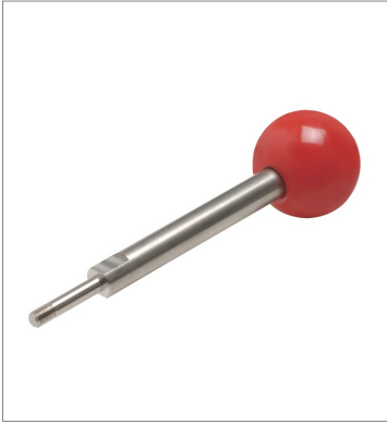
Inner lever for Slide Key Unit