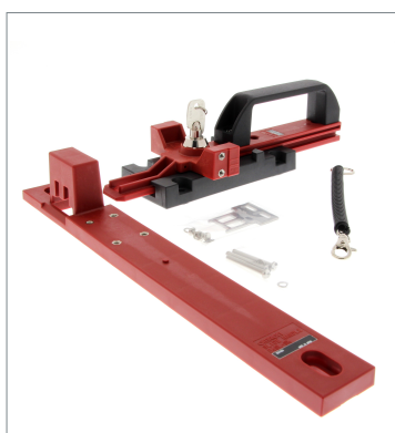
Slide Key D4SL-NSK10-LK