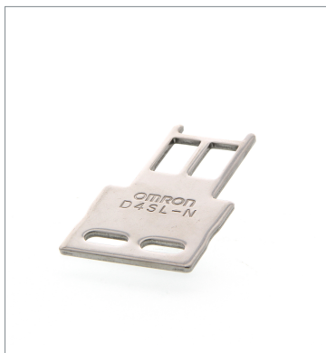
Operation key D4SL-NK1