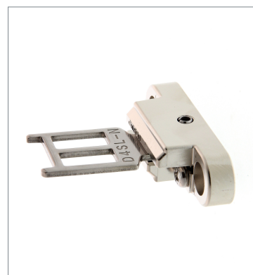
Operation key D4SL-NK3