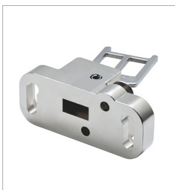
Operation key D4SL-NK5