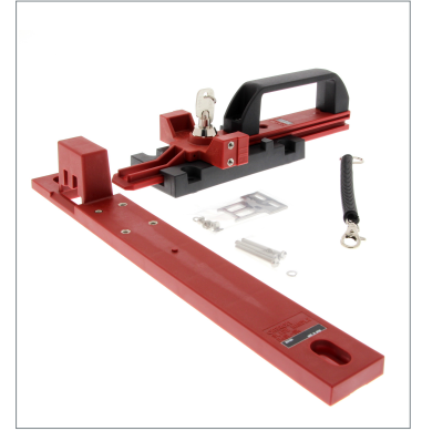
スライドキーユニット D4SL-NSK10-LK