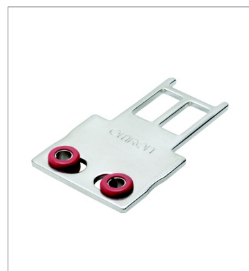
Operation key D4SL-NK1G