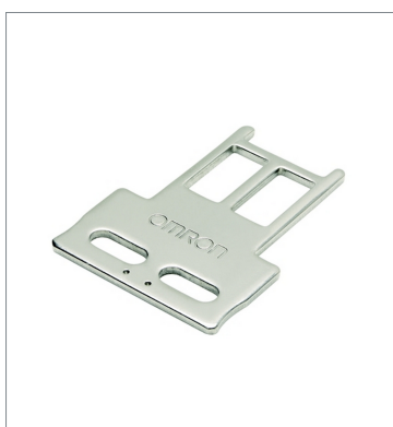
Operation key D4SL-NK1S