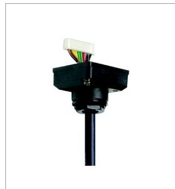
Connector cable D4SL-CN3