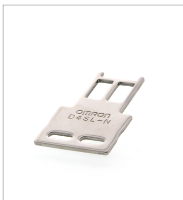
Operation key D4SL-NK1