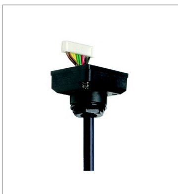
Connector cable D4SL-CN5