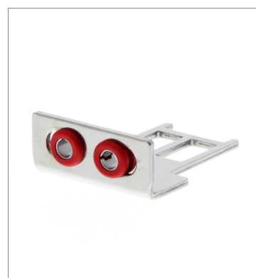
Operation key D4SL-NK2G