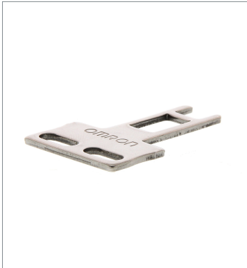
Operation key D4DS-K1