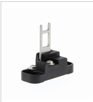
Operation key D4DS-K5