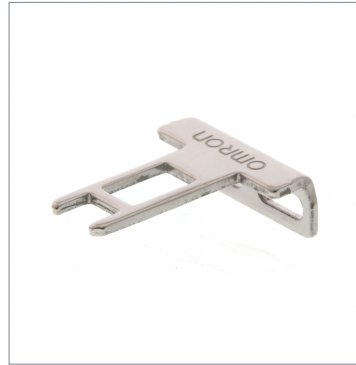
Operation key D4DS-K2