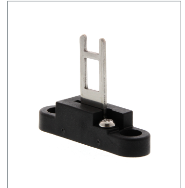
Operation key D4DS-K3