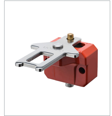
Operation key D4JL-K3