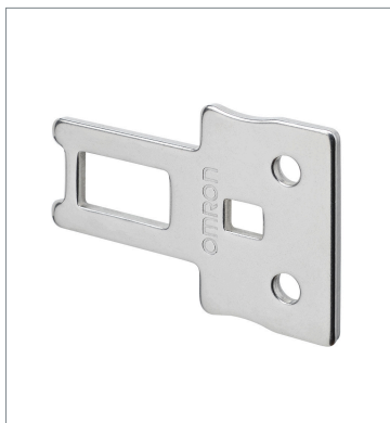
Operation key D4JL-K1