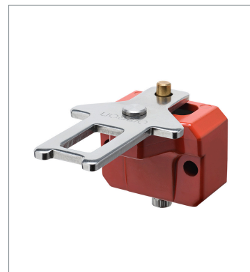
Operation key D4JL-K3