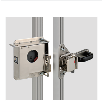
Slide Keys D4JL-SK40