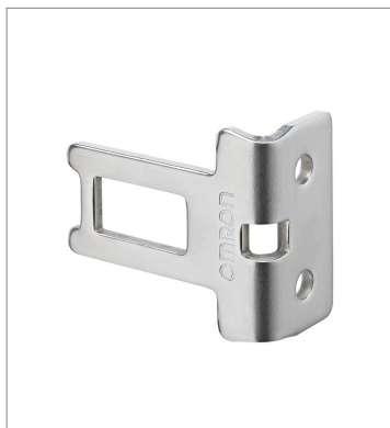
Operation key D4JL-K2