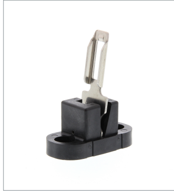
Operation key D4GS-NK4