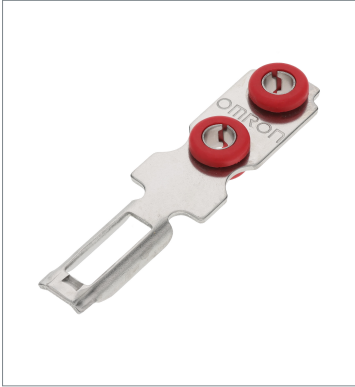
Operation key D4GS-NK1